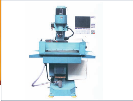
Гравировально-фрезерный станок с ЧПУ мод.ЛФ250ФЗ