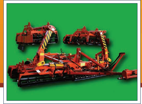
Комбинатор ЛК-6 для поверхностной предпосевной обработки почвы